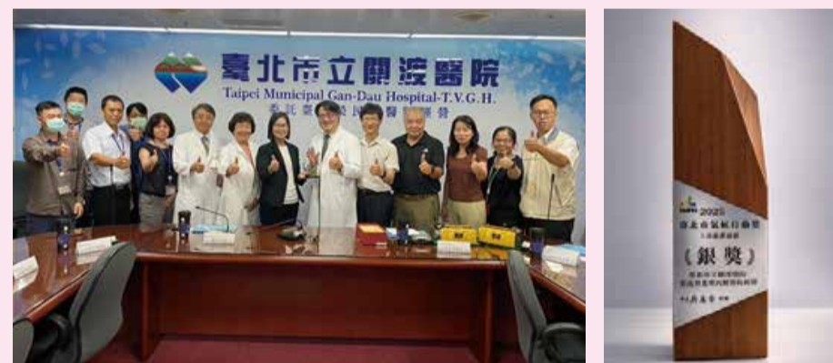
113 年經濟部能源署評審委員到院實地訪查