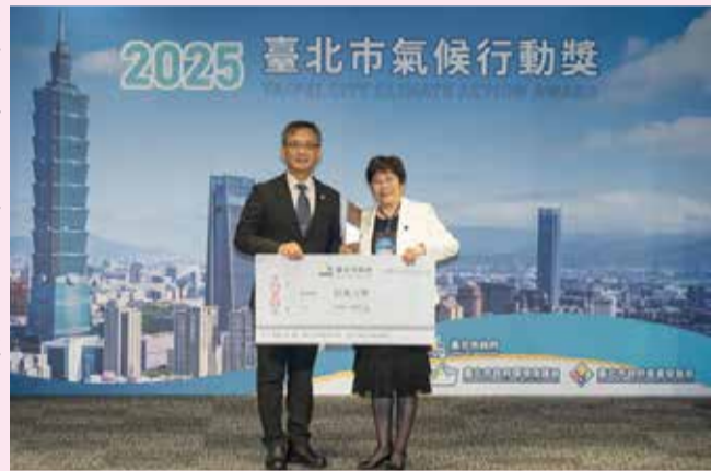
張溫德副市長頒發本院氣候行動獎銀獎獎牌

為了讓節能更精準，醫院於 2024 年建置了「BEMS 能源管理系統」，利用大數據與 AI 預測能源流向，實現數位轉型。本院獲得了臺北市氣候行動獎銀獎、零碳標竿特優獎、經濟部節能菁英獎、內政部綠建築銀及標章等殊榮，但我們沒有停下腳步，更積極展望未來，執行健康臺灣深耕計畫落實 ESG 節能減碳與永續經營，進行 ISO 14064-1 溫室氣體盤查、導入 ISO 50001 能源管理系統取得國際驗證、發行 ESG 報告書揭露成果，致力於達成 1.5°C 的減排路徑。建構「綠色韌性醫院」向社會大眾證明了：本院在專業治癒病痛的同时，也能透過科技與管理，守護健康也守護地球，引領社會邁向一個更加美好的永續未來。